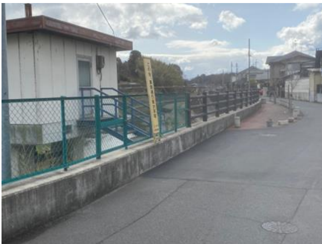
平成29年21号台風 溢水箇所葛下樋門付近 パラペット構造