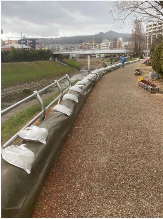
王寺町役場付近左岸