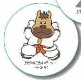
上牧町商工会キャラクター 上牧べたろう