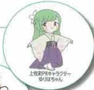
上牧町PRキャラクター ゆりはちもん